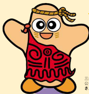
三内丸山遺跡 公式マスコットキャラクター さんまる