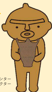
函館市縄文文化交流センター 公式マスコットキャラクター どくろ館長