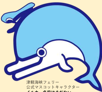
津軽海峡フェリー 公式マスコットキャラクター イルカ、名前はまだない...