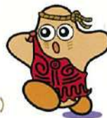
三内丸山遺跡 公式マスコットキャラクター 「さんまる」