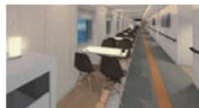
プロムナード どなたでも自由にお使いいただけるプロムナードでおしゃべりや、お食事、海の景色を楽しみながらごゆっくりお過ごしください。