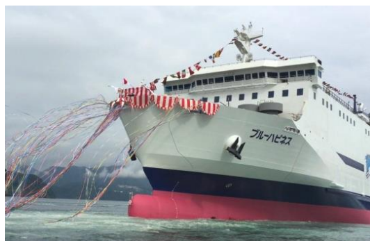
2016年9月28日進水式（内海造船株式会社瀬戸田工場）