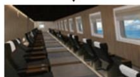
ビューシート 進行方向に向けた、海を眺めながらくつろげるリクライニングシートを用意しました。上質なカジュアルクルーズをお楽しみください。

※船内図は 2016 年 10 月現在のものです。実際と若干異なる可能性がございます。※画像はイメージです。