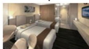
スイート バス・トイレ付のツインの個室。ご夫婦、カップル、ご友人同士でゆったりとおくつろぎいただけます。