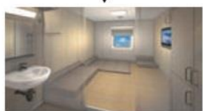
コンフォート マットレスを引くタイプの和室。小さいお子様がいるご家族の方などに安心してご利用いただけます。