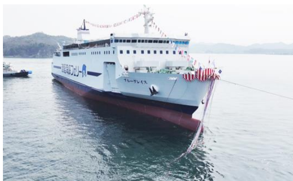
2025年3月27日進水式の様子（内海造船(株)瀬戸田工場）