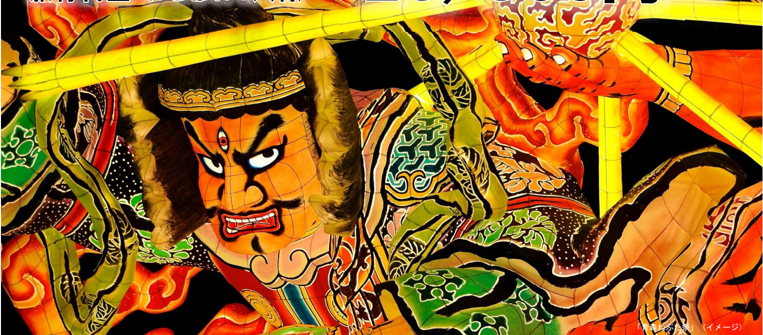
「青森ねぶた祭」(イメージ)