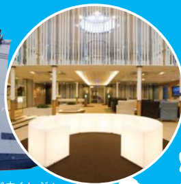
ブルードルフィン船内イメージ ※就航船により船内の仕様は変わります